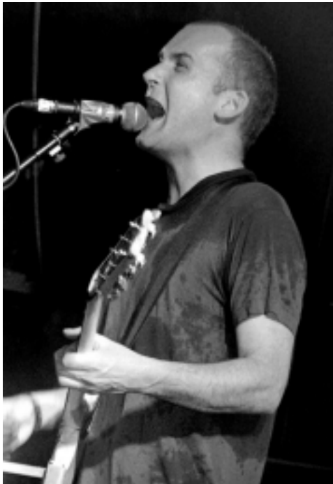
ian mackaye schwitzend beim gitarrensport

nigerweise „i run away with you“, von nomeansno lasse ich mich später etwas langsamer den hügel hinaufziehen und am ende bringen mich helmet wieder gut nach hause, auch wenn bei denen zwischendurch immer wieder der geschwindigkeitsrausch zu spüren ist – dem man sich nicht hemmungslos