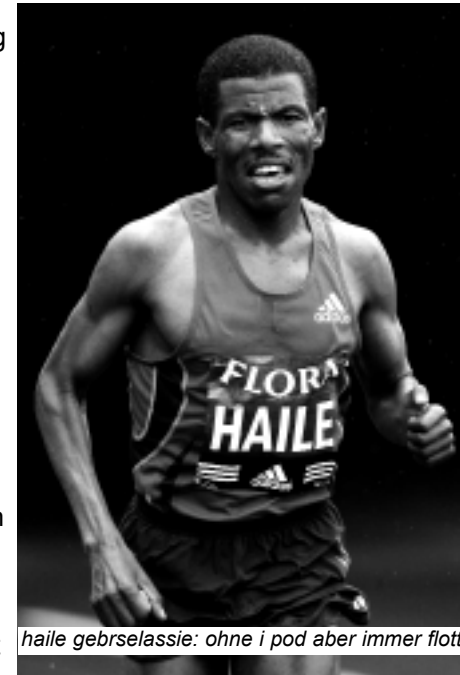
haile gebrselassie: ohne i pod aber immer flott